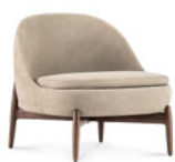
05 SENDAI POLTRONE CM 74X76 H72