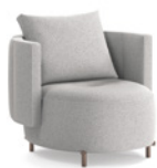
03 TORII BOLD POLTRONE MEDIUM CM 88X88 H82