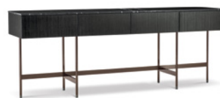
10 KENNETH CONTENITORE LIVING CM 240X55 H90