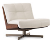
04 DAIKI POLTRONE GIREVOLI SENZA BRACCIOLI CM 73X91 H69